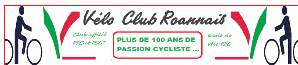
VELO CLUB ROANNAIS